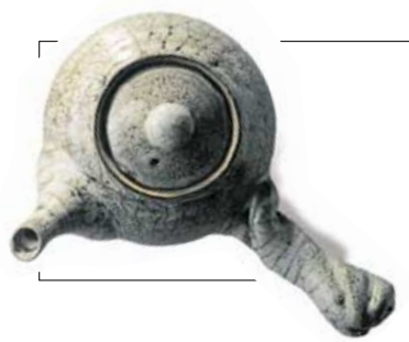
남지지도 모자리지도 없게 물을 띄어 장성으로 우려낸 좋은 차 향기가 조각에 가득찬 채로

경기도 여주군 가남면 송림리 208번지 휴대폰 018-315-9080 전화 겸용 팩스 031)883-9080 E-mail: dasund100@yahoo.co.kr