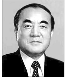
나카소네 전 일본수상

8살 때부터 무예를 익혀온 중국출신 배우 이연걸(렛 리도) "최근 5년 동안 불교적 수행을 하면서 최고라는 명성을 지키기 위해 받았던 압박감을 털어낼 수 있었다"고 말했다. 이밖에도 텔레비전 시리즈 '트윈픽스'로 우리에게도 친숙한 데이비드 린치 감독, 배우 해리슨 포드, 키아누 리브스 등이 명상에 심취, 주변에까지 권