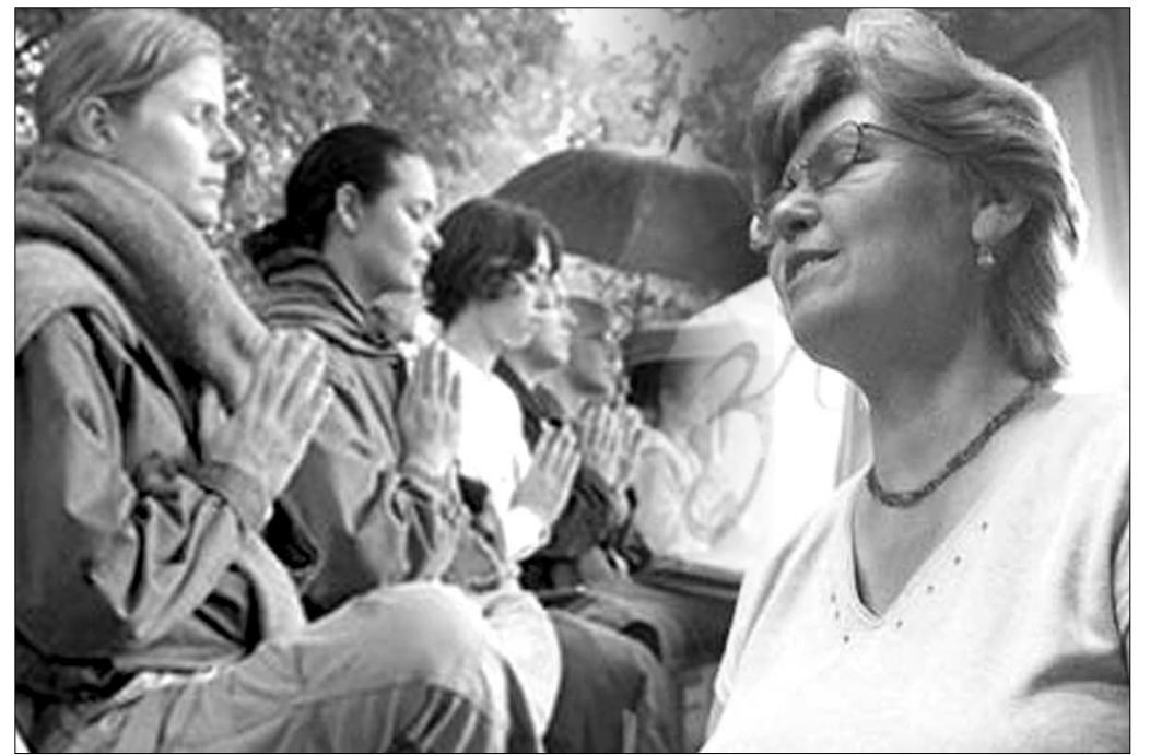
서구사회의 명상연구가 나날이 늘고있다.

불교가 서구에 본격적으로 알려지기 시작한 19세기 무렵, 소위 '엘리트'인 사회 지도자층이 불교에 적극적인 관심을 보였다. 오늘날에도 옐고