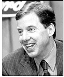
빌 포드 회장