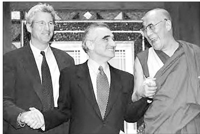
리처드 기어(왼쪽 끝)와 달라이 라마(오른쪽 끝).