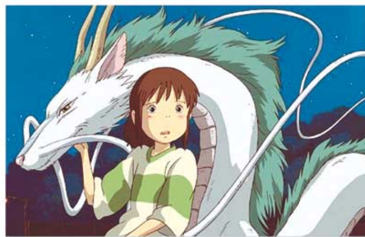
◇일본 애니메이션 ‘센과 치히로의 행방불명’의 한 장면.

9월 17일 영화와 음반, 게임분야까지 완전 개방하는 ‘일본대중문화 4차 개방’이 발표됨으로써 내년부터 본격적인 일본대중문화의 수입이 가능해질 것이다. 물밀듯 밀려들어오고 있는 일본문화, 불교계에서는 어떻게 바라봐야 하고, 또 무엇을 배울 수 있을까?