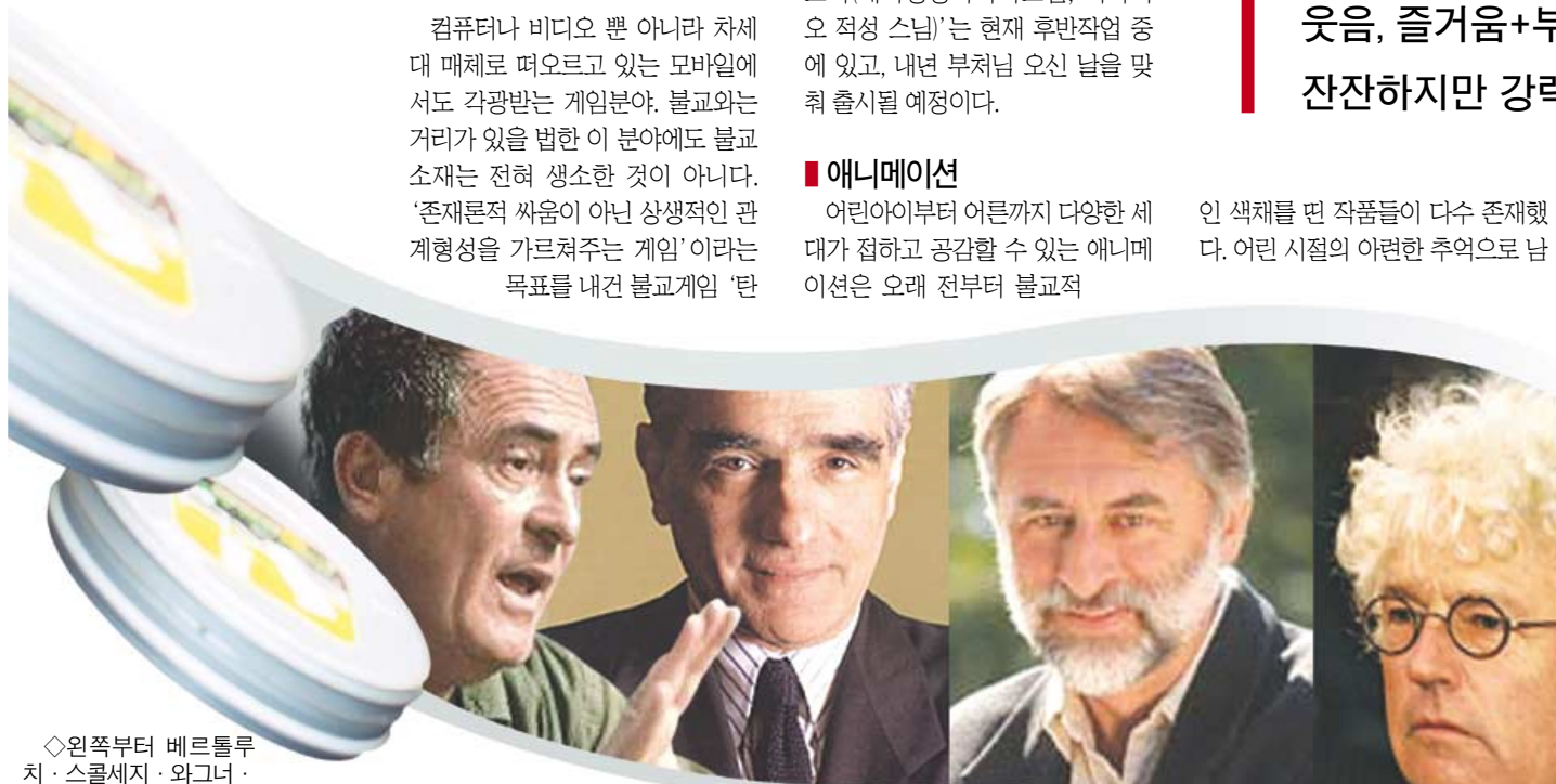
◇왼쪽부터 베르톨루치·스콜세지·와그너·장자크 아노. 감독이래는 워쇼스키 형제.

워쇼스키 형제, 마틴 스콜세지, 장자크 아노 감독... 불교와 관련된 영화를 만들기 전, 혹은 만드는 동안 그들은 불교를 어떤 의미로 여기고 있었을까? 세계 유명 감독들이 인터뷰를 통해 언급했던 불교관을 정리해 보았다.