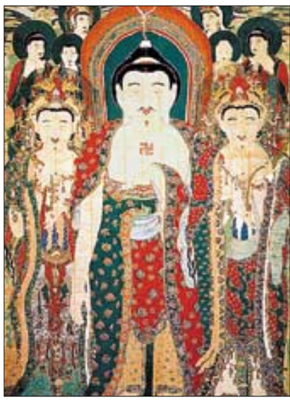
◀국보 제302호 청곡사 괘불탱.

통도사성보박물관(관장 범하스님)이 통도사(주지 현문스님) 개산 1358주년과 통도사성보박물관 중앙괘불전에 전시되는 국보 제 302호 청곡사괘불탱 특별전을 기념해 괘불을 테마로 한 세미나를 연다.