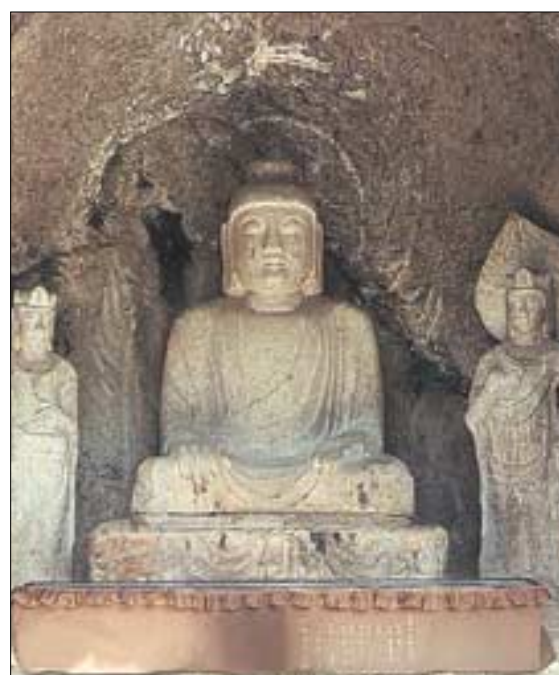
◀군위삼존불은 통일신라의 자신감과 권위적인 이미지가 처음 나타난 불상이다.

신라가 삼국을 통일한 것은 역사 속의 기적이다. 신라는 삼국 가운데 가장 국력이 열세이고, 지역도 가장 후미진 곳에 위치하고 있었다. 고구려는 중국과 어깨를 나란히 하던 강대국이었고, 백제는 불교를 일본에 전파할 만큼 국제적 역량을 갖춘 나라였다. 그러나 정작 삼국을 통일한