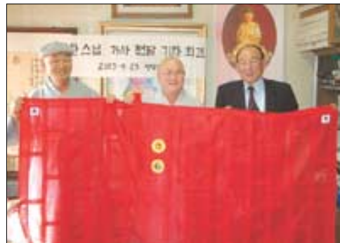
◊북한에 지원할 가사를 펼쳐보이는 평북협 대표단.