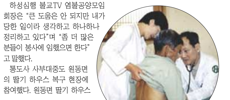
◊사진 왼편은 선재마을의료회 무료 진료 활동을 벌이는 모습. 아래 사진은 통도사 사부대중이 수해복구 현장에서 자원봉사를 펼치는 모습.