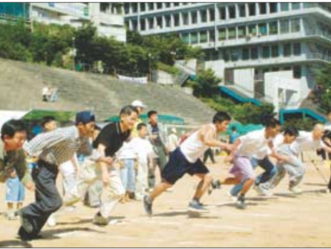
◊행사참가자들이 100m 달리기를 하고 있다.