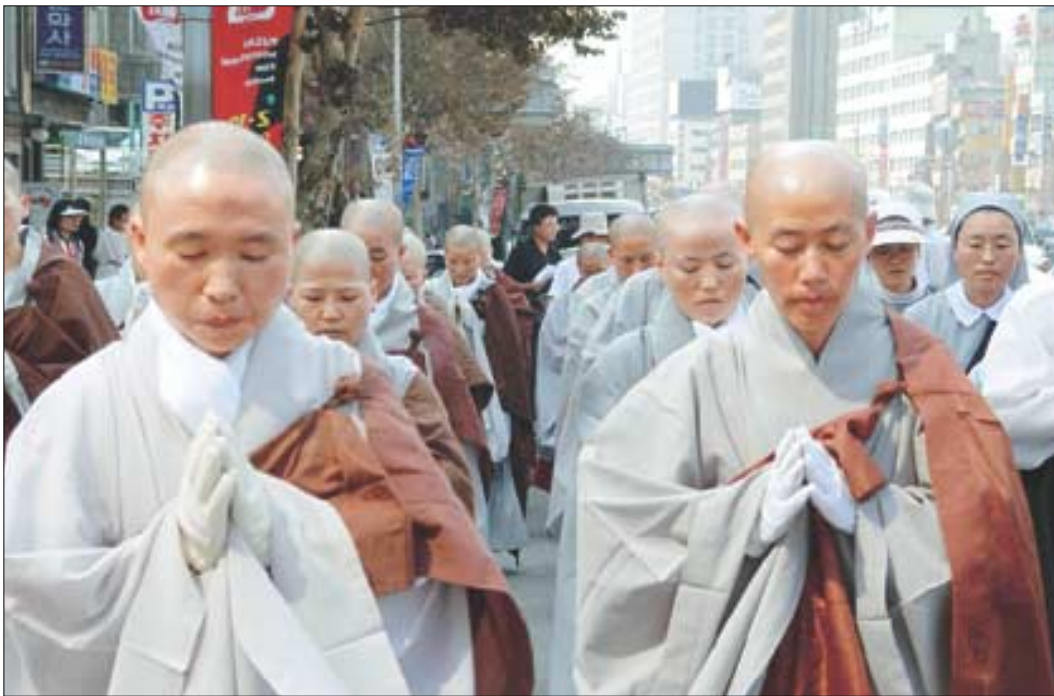
'천성신을 살립시다' 천성신을 지키기 위해 여성성직자들이 나섰다. 불교, 천주교, 원불교 여성 성직자들은 정부의 경부고속철도 천성산 터널공사 강행에 항의하며 9월 26-10월 8일 13일간 부산역에서 천성산 정상 화엄봉까지(총 50Km) 삼보일배를 정진한다. 사진은 첫날 부산역을 출발한 비구니 스님 등 여성성직자 50여명이 삼보일배를 하는 모습. 관련기사 14번

북한산 관동도로 해법으로 정부가 공론조사를 제의했다. 그러나 불교 환경·사회 단체들은 강력 반발하고 있다. 이런 가운데 조계종은 환경·사회단체들의 의견을 수렴해 공론조사 수용여부를 최종 결정기로 함으로써 그 결과가 주목된다. 노무현 대통령은 9월22일 조계종 총무원장 법장스님과의 정외대 오찬에서 공론조사를 통해 북한산 문제를 해결하자고 제의했다. 관련기사 3번