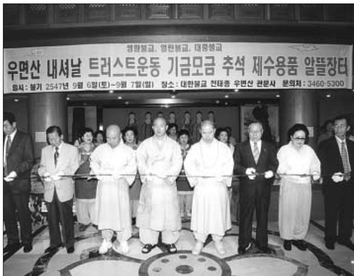
○관문사는 우면산 내셔널트러스트 운동 등 지역사회 현안에 적극 참여함으로써 대중적으로 파고들고 있다. 9월 6일 관문사에서 열린 트러스트 운동 기금 마련을 위한 알뜰장터의 개막식 모습.