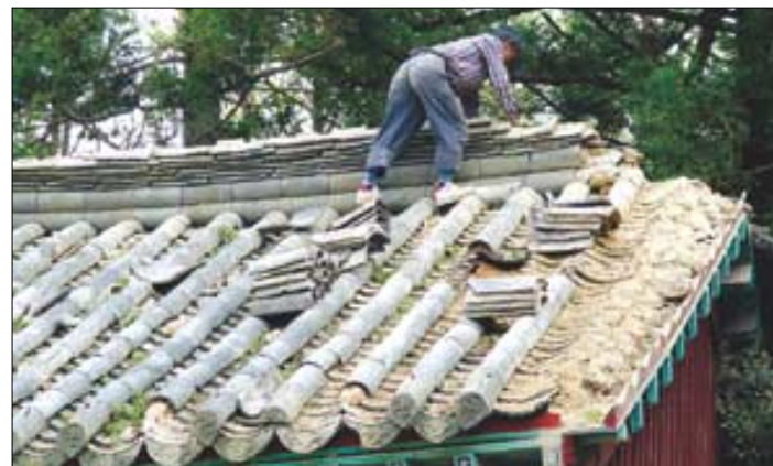
△범어사대웅전 지붕의 기와가태풍 '매미'에 의해 훼손된 모습.

그 외의 문화재 복구 비용은 중앙재해대책본부와 문화재청의 실사 후 문화재청의 재난대비 사후관리비(올해 20억)의 책정과 정부와 시·도의 재해 복구 예비비로 지급된다. 오유진 기자