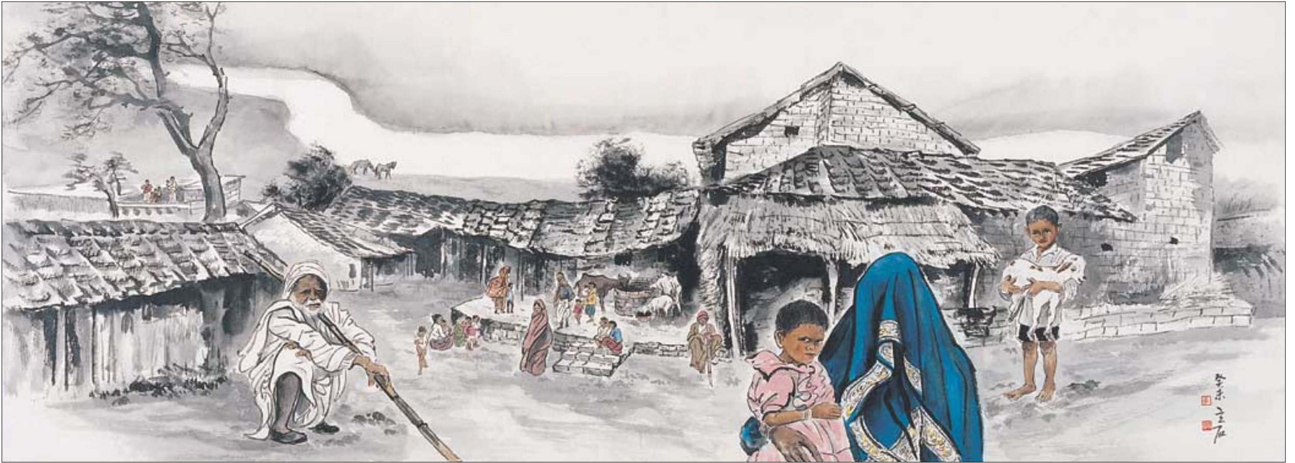
◇아무르강의 그루와 마을 (199×70cm).