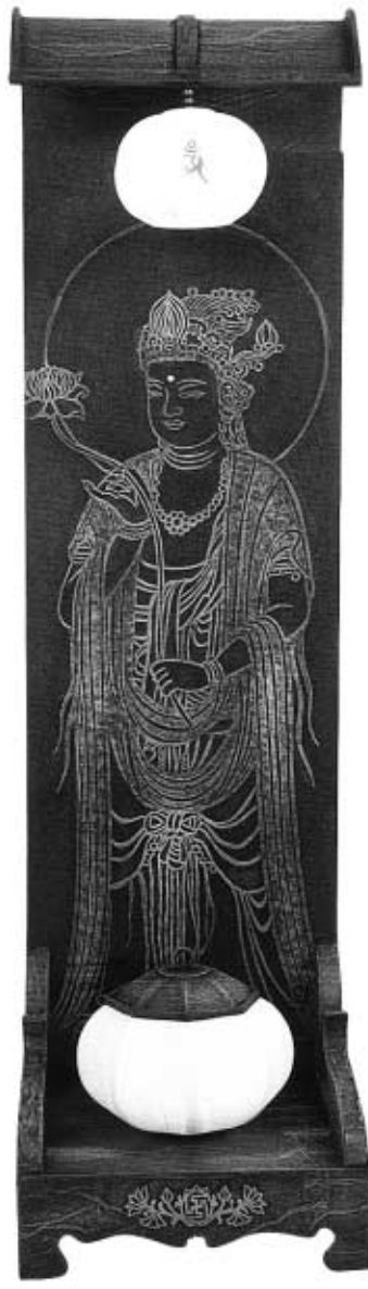
◇스텐드로 사용되는 '불감등'.