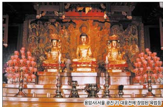
용암(서서울,광진구) 대웅전에 장엄된 육법등