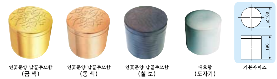
연꽃문양 납골추모함 (금 색), 연꽃문양 납골추모함 (동 색), 연꽃문양 납골추모함 (철 보), 내호함 (도자기), 기본사이즈