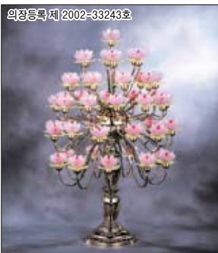
의장등록 제 2002-33243호