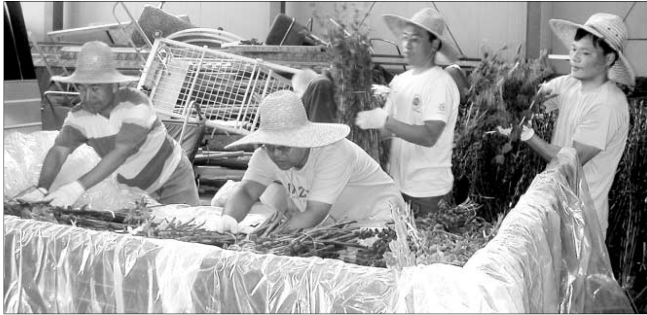
조계사 청년회원들이 창고에서 말리던 깨묵음을 차에 싣고 있다.

무주상보시 정신으로 9년째 봉사 제철 일거리 기록 노하우 축적 자녀들과 함께하는 산교육장