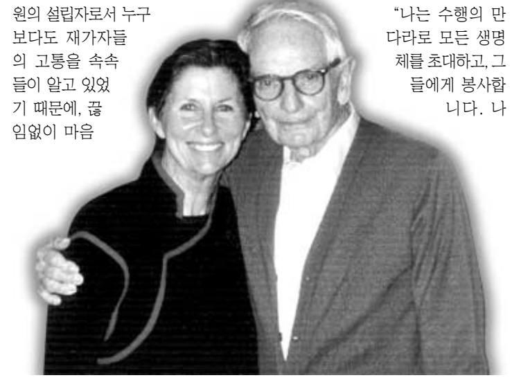
미국의 유명한 사업가인 록펠러(우)와 함께한 헬리팩스.

"나는 수행의 만다라로 모든 생명의 고통을 속속들이 알고 있었기 때문에, 끊임없이 마음