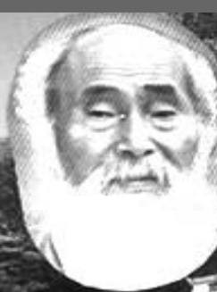
▶ 마이산 탐사와 탐영제

관광과 방생을 한곳에서! 기묘한 산이 있어 좋고, 불가사의한 탐이 있어 신비스러운 곳, 이태조가 백일기도를 드린 영험있는 기도도량. 섬진강 맑은 물의 탐영제방생기도