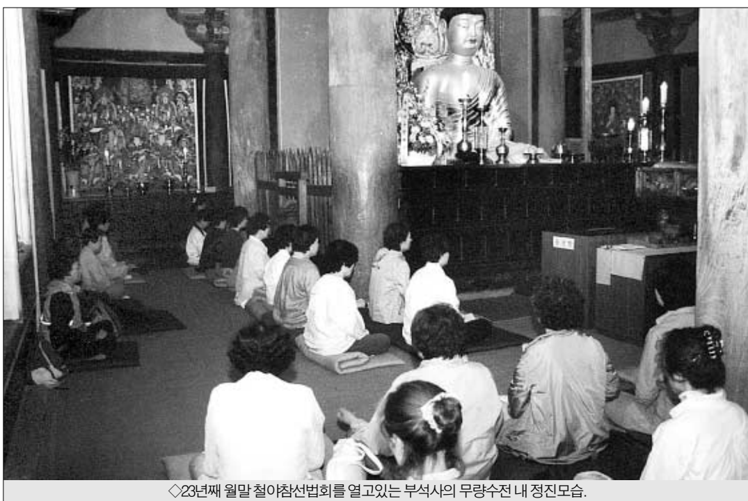
◇23번째 주말철야참선법회를 열고있는 부석사의 무량수전 내 정진모습.

“이 곳은 날씨에 변잡한 일사사를 벗어나고 전국에서 모인 재가 수행자들은 참으로 희유한 불자들로서, 참된 법보시를 실천하고 계신 겁니다. 철야정진동안 끊임없이 회광반조하며 화두를 챙겨서 생사해탈하시기 바랍니다.”