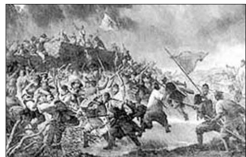
1592년 8월1일 영규대사와 800승병들이 조현의 700의 병과 청주성을 탈환하는 모습.

영규대사와 800 승병의 이야기가 일반국민들에게 알려진 것은 2000년, 계룡산 감사주지 장곡사가 기허당 영규대사 열반이후 처음으로 대제를 지내고, 학술회의를 열면서 부각됐다.