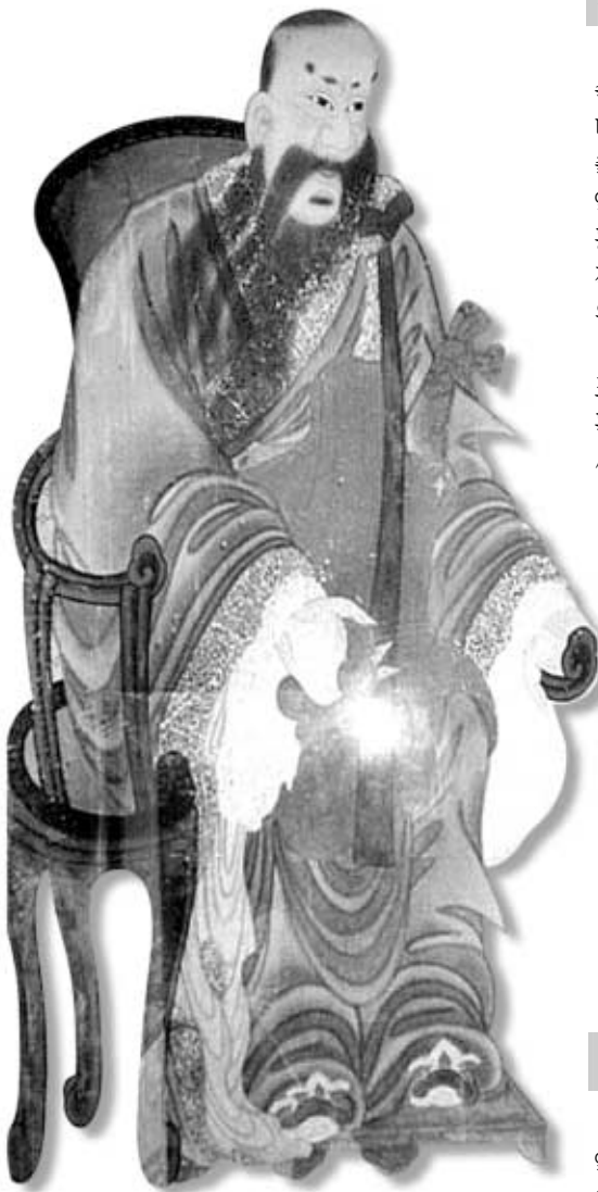
계룡사 감사 보좌각에 모셔져 있는 영규대사영정.