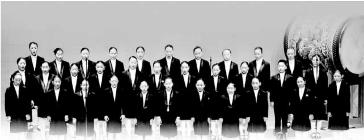
◇지난해 12월 세종문화회관에서 열린 '제9회 정기연주회' 공연모습.