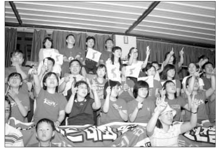
◇대불청 회원들과 기독교, 천주교 청년들이 북한팀 합동응원전을 펼치는 모습.

3개 종교 청년합동응원단은 "우리는 하나다", "오! 통일코리아" 등을 외치며 아리랑응원단과 호흡을 맞췄다. 박원규 기자 bak09@buddhapia.com