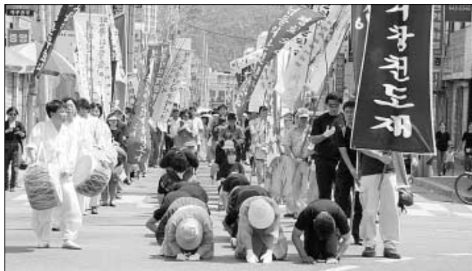
◇한국전쟁 전후 학살된 고인들의 넋을 위로하는 천도제 모습.

한국전쟁 전후로 발생했던 민간인 학살 진상 규명을 통해 평화와 인권의 소중함을 일깨우는 제 15회 평화인권예술제가 23일, 24일 거창에서 개최됐다.