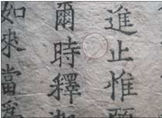
◇고려시대 새로운 각필구결 양식을 보여주는 법화경 수덕사본. 점선 안에 보이는 점과선이 각필구결이다.

예산 수덕사 박물관에 소장돼 있는 법화경 권 7 제24장 묘음보살품에서 13세기 초 것으로 추