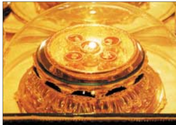
◇건봉사사리탑에서 나온 부처님 진신자아 사리 12과중 중무소에 소장 중인 5과.

국립문화재연구소는 현재까지 소장처가 확인되지 않은 14점 가운데 상당수는 일제강점기 도굴된 것으로 추정, 추적이 곤란한 것이 포함되어 있다고 설명했다. 또 목재나 사리공(舍利孔) 뚜껑과 같은 발견품의 특징상 복원 시 재사용되었거나 시료 등으로 취급되었을 가능성도 배제할 수 없을 것으로 추정했다. 이와 관련 국립문화재연구소는 소장처 미확인 사리장엄구 14점에 대해 집중적으로 소재파악에 나서겠다고 밝혔다.