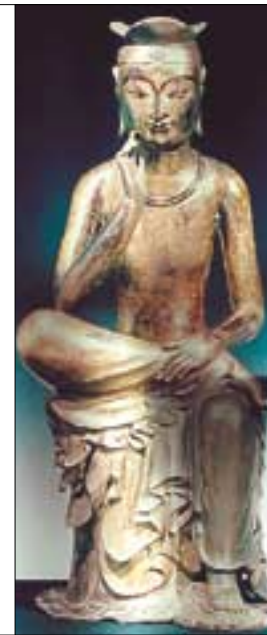
◇국보 제83호 금동반가사유상(오른쪽)과 교류지 목조반가사유상(왼쪽) "이 불상은 우리를 인간이 지닌 마음의 영원한 평화의 이상을 진실로 남김없이 최고도로 표정하고 있는 것입니다." (야스퍼스)

알려주고 있다. 독일의 미술사학자 빙켈만(J.J.Winckelmann, 1717-1768)이 그리스 조각의 특징으로 평가한 "고귀한 단순성과 정숙한 위대함"이란 말은 오히려 이 불상을 보면서 떠올려 보았다. '아름답다', '멋있다'라는 찬사가 매우 인간적인 것이기 때문이다. '고귀하다'라는 찬사는 보다 종교적이고 이념적인 차원의 것이다. 독일의 철학자 야스퍼스를 일본을 방문했을 때 이 불상을 보고 다음과 같은 감상을 남겼다. 그 일부를 옮겨 본다.