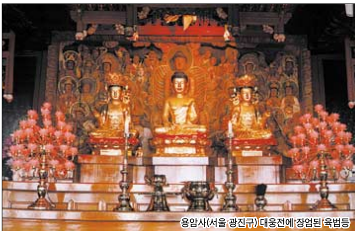
용암사(서울 광진구) 대웅전에 정엄된 육법등