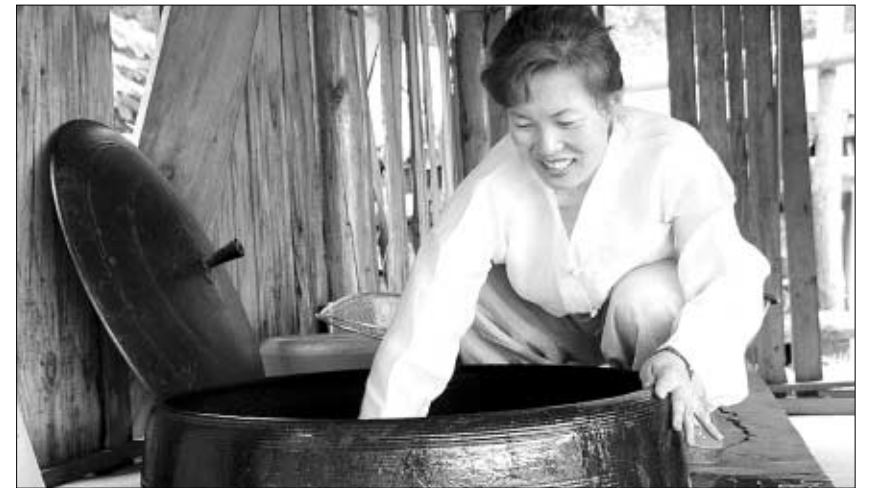
◇부산선암사 자광화보살은 하루 1만여명의 밥을 가마솥으로 지어 대중들에게 공양하는 소임을 맡고 있다.