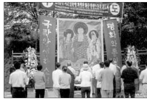
◇평화실천광주전남불교연대의 화순탄광노동자천도제모습. 먼 구암리에서 미군 차량행렬이 4백여 명의 노동자들에게 집단발포 해 10여 명이 사망했다.

노동자의 넋을 달았다. 행법스님은 추도사에서 "다시는 이 땅에 억울한 죽음을 당하는 시대가 돌아오지 않도록 모두가 사회의 파수꾼이 되어 진정한 자유와 평화를 실현하자"고 말했다. 화순탄광 노동자 학살 사건은 1946년 8월 15일 해방 1주년 기념식에 참가하던 탄광 노동자 3천여 명을 미군이 강제 해산하는 과정에서 노동자 7~8명이 미군의 총에 맞아 숨진 사건이다. 이후 11월에도 화순군 동