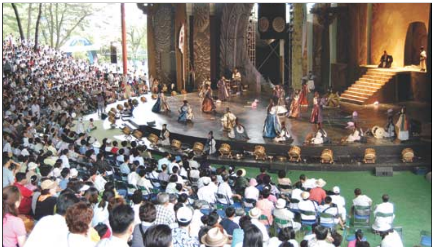
경주 세계문화엑스포 개막

스님과 환경, 행정자치, 문화관광, 건설교통, 보건복지, 교육, 검찰, 법조, 경찰, 여성, 기업, 언론 등 14개 분야 재가전문가 16명으로 구성됐다. 대정부정책자문위원회는 총무원장 직속 상설기구로 설치되며, 필요시 수시로 회의를 소집해 현안을 다루게 된다. 한명우 기자