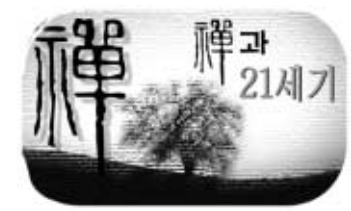
선의 세계 ⑤

어떤 태도를 문제삼는 것일까? 여러 가지들 꼽을 수 있겠지만, 무엇보다도 경전 공부 자체가 불교 수행의 모두라고, 또는 적어도 가장 중요한 것이라고 여기는 태도를 들 수 있다. 자기가 관심을 가지고 하는 일, 자기에 재미있는 일, 자기가 잘 하는 일, 자기