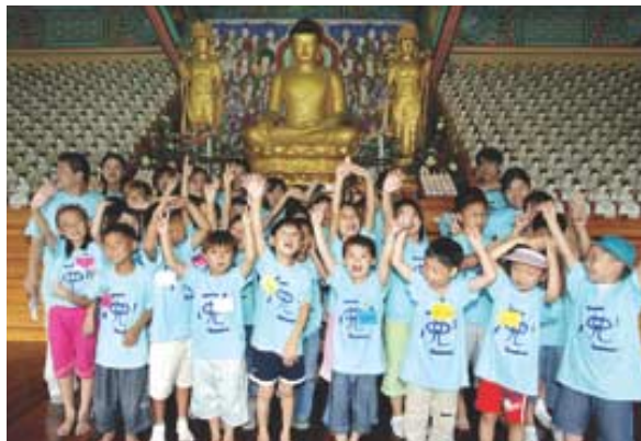
◇"부다피아 캠프 너무 재미있어요" 관음사 대웅전에서 기념촬영을 하고있는 어린이들.

7월 29일 오전 9시 조계사 앞. 관광버스를 타는 아이를 걱정스럽게 쳐다보는 엄마가 "선생님 말씀 잘 듣고 잘 다녀와"라며 작별인사를 한다. 아이는 엄마에게 "예"하고 외치며 버스에 오른다. 엄마는 걱정이 되는 듯 버스 밖에서 서성거리며 아이를 쳐다보지만, 아이는 배웅 나온 엄마가 안중에도 없다. 캠프에서 새로운 친구들과 사귀고, 신나게 물놀이도 하며 재미있는 볼거리에 마음이 들떠있기 때문이다.