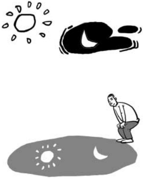
그림 · 최추현

*위 법문은 대행스님 법어집 『한마음』의 내용 중에서 52호를 발췌한 것입니다. 한마음선원 홈페이지(www.hanmaum.org)나 한마음선원에서도 같은 내용을 보실 수 있습니다.