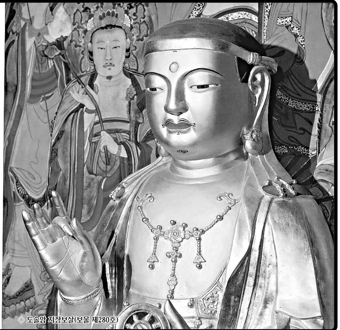
◇도솔암 지장보살(보물 제280호)