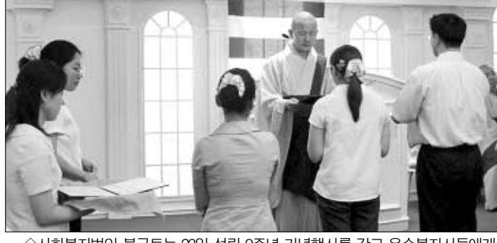
◇사회복지법인 불국토는 23일 설립 9주년 기념행사를 갖고 우수복지사들에게 포상금을 지급했다.

불국토 9주년 ... 우수 프로그램 등 포상 작으로 부산불교계 최초로 개금사 회복복지관을 위탁받았고, 사회복지법인 불국토를 설립했으며 97년에는 국고 지원을 받아 영주안 어린이집을 개원했다. 또한 2001년에는 불교계 최초로 정신 장애인 사회복지시설인 컴·넷 하우스를 개소해 불교계 사회복지사업의 새로운 영역을 개척했다. 이 밖에도 98년에는 부산시 최초의 청소년수련시설인 민간 위탁 운영 법인으로 선정되어 청소년 사업에서도 선두주자로 나섰다. 중산층, 서민을 위한 실비요양보호시설 확충을 2003년 주력사업으로 정한 불국토는 2004년에는 노인요양 사업에 전력할 계획이다. 천미희 기자