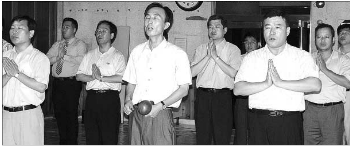
◇부경대학교 불교동문회는 11일 부산 소림사에서 정기법회를 봉행했다.