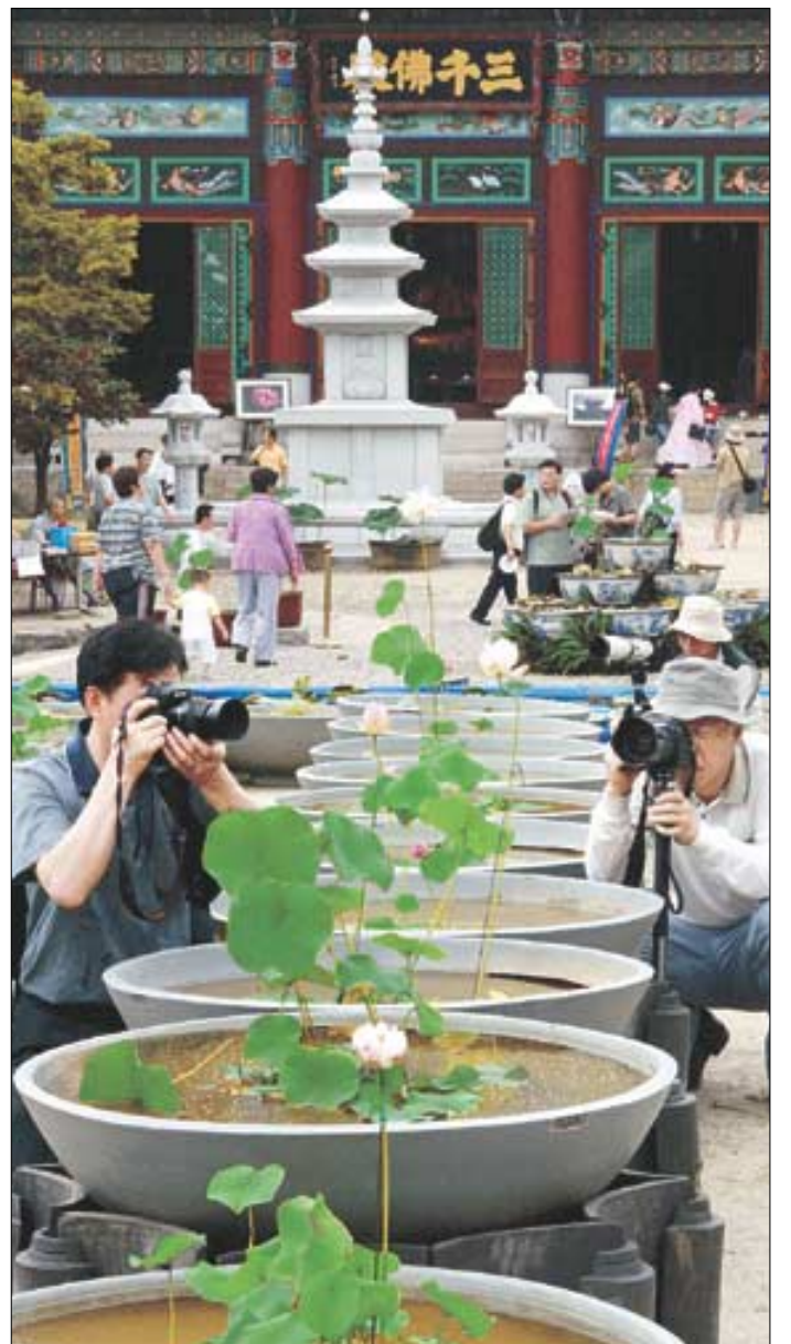
연꽃 보러 오세요 서울 봉림사에서 17일 시작된 '제1회 서울 연꽃축제'. 8월 12일까지 계속되는 이번 축제기간에는 영산재 및 다도시연, 연잎차시음, 연꽃사진전 등 다양한 행사가 이어진다.