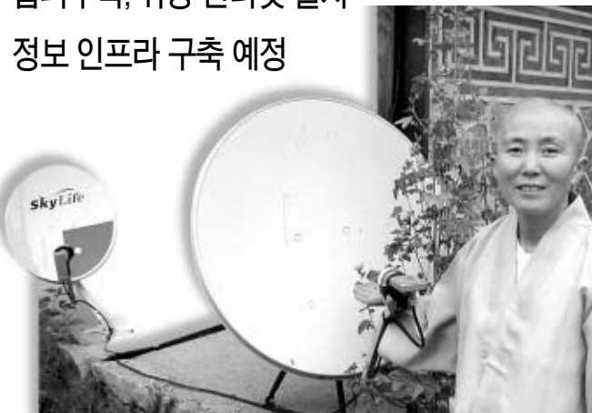
◇보탑사 주지 승려 스님이 위성인터넷 장비 설명하고 있다.

역할이 컸다. 현재 사이버 공간에는 보탑사를 사랑하는 사람들, 즉 일종의 매니아층이 형성되어 있다. 실제로 한 네티즌은 보탑사에 매료되어 사이버 공간에 보탑사 갤러리(www.botapsa.ye.io)를 개설, 계절별 보탑사 사진과 산사음악회 등 사찰의 행사를 업데이트 하고 있다. 보탑사의 공식 홈페이지는 없지만 지금은 보탑사 스님들의 후원으로 공식 홈페이지 역할을 톡톡히 하고 있다.