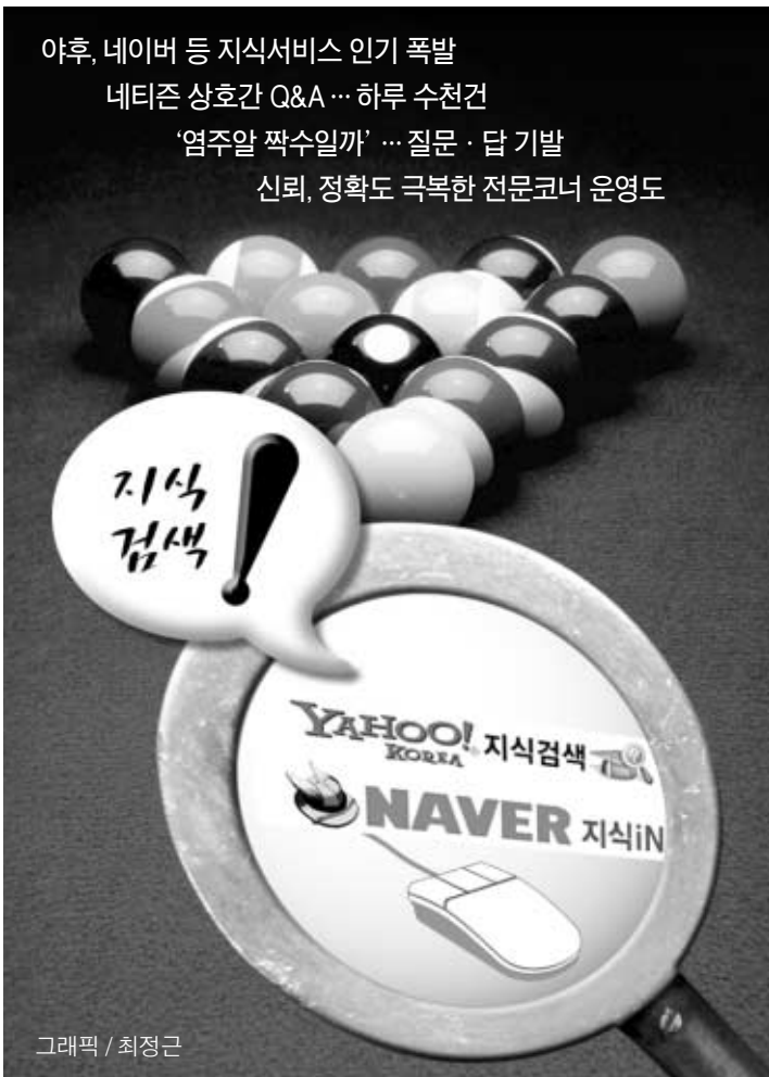
그래픽 / 최정근

네티즌들이 지식검색서비스를 이용하는 주된 이유는 불현듯 떠오르는 ‘왜 약속할 때 새끼손가락을 걸고 할까’, ‘갑육에 갔다오면 왜 별을 달았다고 하나?’ 등 사전에 나오지 않거나 일상생활에서 쉽게 사용되는 말이나 답변을 구하기 어려운 내용에 대한 해답을 얻을