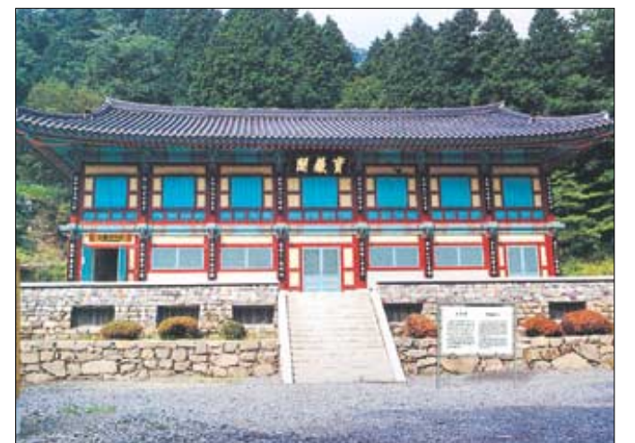
◇99년 건립된 유물전시관 보장각.