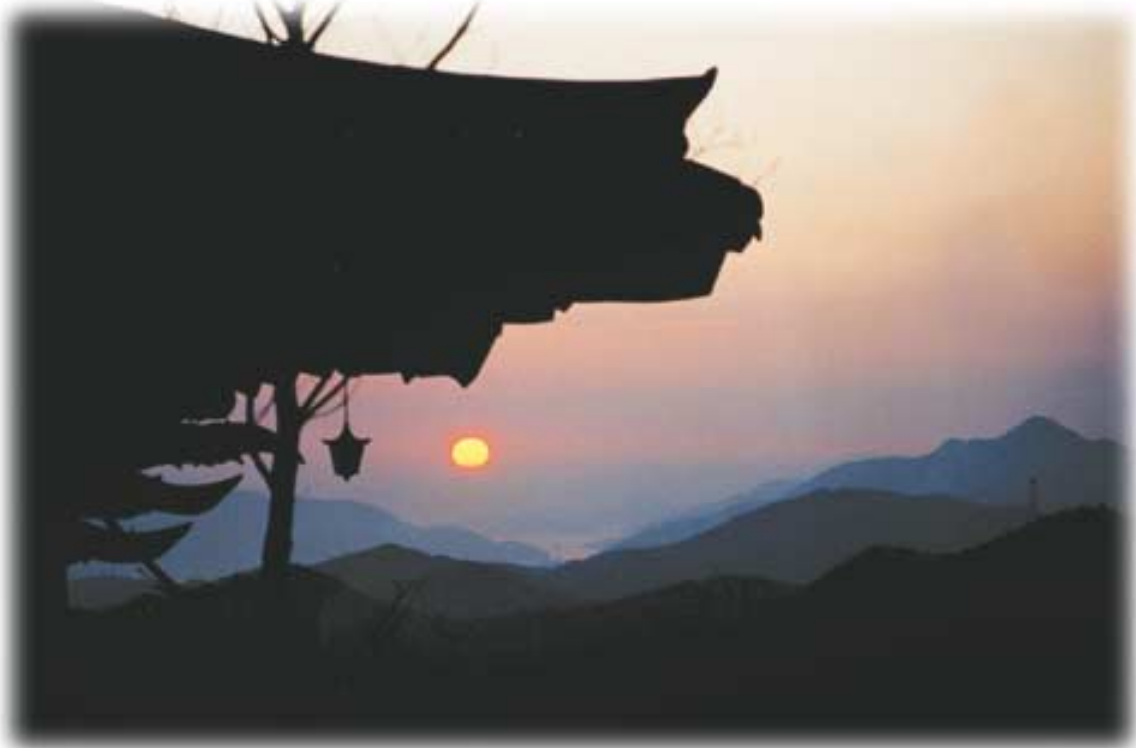
◇옥천사는 연화팔경 가운데 하나로 꼽힐만큼 빼어난 경관을 자랑한다. 적멸보궁에서 바라본 일출.