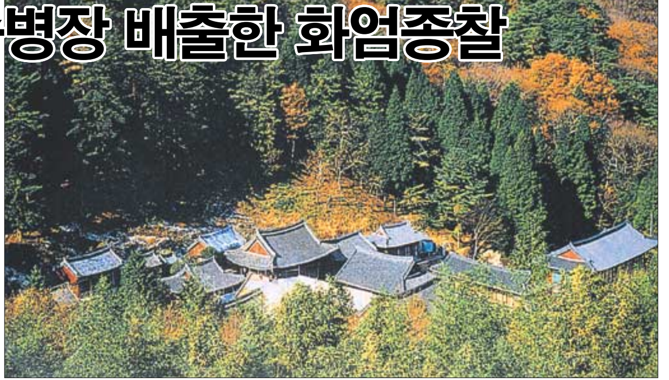
◇옥천사는 30여개 동 전각과 12곳의 암자를 거느린 대찰이다. 연화산 깊숙이 자리한 옥천사 전경.