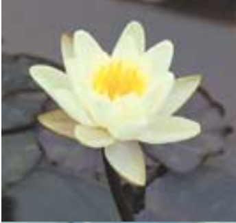
◇6천여평의 넓은 연지를 자랑하는 김제 청운사에는 해마다 여름이면 연밭을 구경하려는 사람들로 북적인다.

에서 벗어나 그윽한 연화향에 빠져볼 수 있다. 이번 기행은 연꽃사찰로 유명한 김제 청운사와 아산 인취사를 비롯해 제1회 세계연꽃축제가 열리는 천안 상록리조트를 하루에 모두 참배할 수 있는 장점이 있다. 기자가 미리 기행코스를 따라가 봤다.