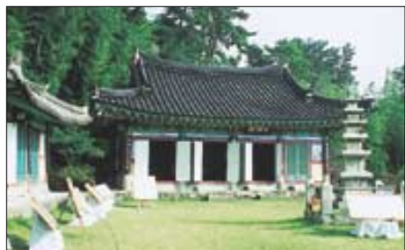
◇정갈하게 단정돼있는 청운사경내