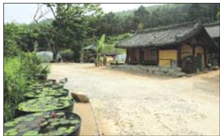
◇연꽃 수반이 가지런히 놓여있는 인취사