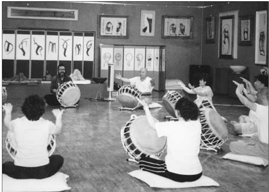
◇명상캠프 참가자들이 불가의 전통음악인 '동해의 소리'를 배우고 있다.

여름이 되면 전국의 사람들은 사람들로 분주해진다. '짧은 출가, 긴 깨달음'을 얻기 위한 사찰수련회에 많은 이들이 참가하기 때문이다. 대개 사찰 수련회는 새벽예불로 시작해 참선, 율령, 108등 스님들이 산사에서 생활하는 것과 똑같은 일정으로 짜여있다. 그래서 근기가 부족한 사람들은 중도에 탈락하거나 힘들어하기도 한다.