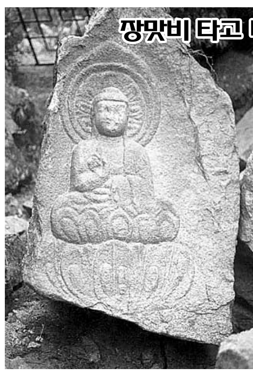
장맛비타면 나투신 마애삼존불상. 숨어 있던 통일신라 마애불이 새로 발견됐다.

이번 수련대회에서는 청담종사 선양사업에 관한 토론, 참선, 선기공, 발우공양, 산행, 법문, 찬불가 배우기 등 다양한 프로그램을 통해 불심을 다진다. 이 밖에도 천수경, 금강경 독경을 비롯 성보문화재 학습, 불교 교화를 위한 토론 등이 진행된다. 문의: (055) 751-3699, 672-0100. 천미희 기자