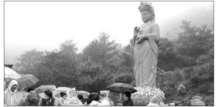
통영 연화사는 6월 27일 신내암자인 보덕암에 해수관을 보살상을 세웠다.