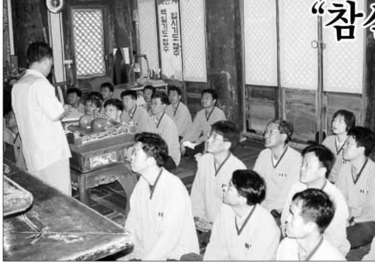
노틸러스호성 팀장급 직원 51명이 종교를 초월해 지난 6월 20-21일 강화 전등사에서 '리더십 강화 수련회'를 열고 참선을 통한 마음 다스리기를 체험하고 있다.