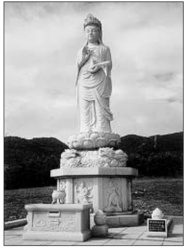
백령도 해수관음상 ‘우뚝’ 남북평화·효행사상 선양

을 진행할 예정이다. 현재 조계사 대웅전은 지붕의 기와가 완전히 해체된 상태며, 1일부터 목 부재 해체작업을 진행하고 있다. 한편 조계사는 900일 맞이 기도법회 기념으로 대웅전 앞마당에서는 탁본 체험 행사와 대웅전 탱화 위에 장엄돼 있던 용반(화반양식) 등의 전시회와 경과보고 사진전을 개최했다. 김원우기자