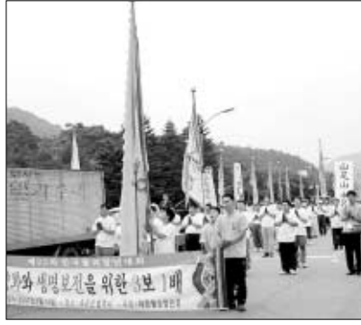
을 위한 삼보일배(사진)를 봉행, 평화를 염원하는 청년불자들의 의지를 대내외적으로 천명했다.

교종단협의회상을 각각 수상했다. 이번 불교청년대회에서 가장 눈길을 끈 프로그램은 6·15 남북공동성명 발표 3주년을 맞아 열린 '대불청 평화문화축제'와 '평화와 생명 보전을 위한 삼보일배'. 1, 2부로 나누어 진행된 평화문화축제에서는 이라크 전쟁과 대구지하철 등으로 인해 고통받는 가족과 영령, 자연파괴로 생명을 잃은 중생을 애도하는 발원문이 봉독됐다. 또한 청년불자들의 참여와 결의를 담은 촛불의식과 평화기원 탑 쌓기 등 다채로운 행사가 펼쳐졌다. 15일에는 잔디광장에서 범주사 청동대불 앞까지 1천여 청년불자들이 6·15 남북공동선언 실천을 촉구하는 '평화와 생명 보전