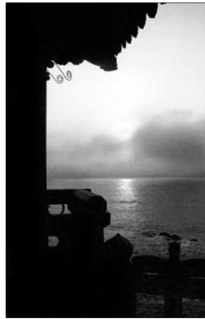
◇낙산사 홍련암의 일출 광경.

기가 나옵니다.”라고 소개한다. 특히 이 경전중에서 스님이 불자들에게 강조하는 부분이 또 있다. 바로 ‘제바달다품’이다. “제바달다품’에는 부처님을 살해하려고 했던 잔인한 ‘제바달다’를 오히려 나의 스승이 있으며, 나의 성불은 그의 공덕에서 비롯됐다고 한 부처님의 위대한 설법이 담겨 있습니다. 수행자인 저에게 더 없는 큰 가르침이 되고 있지요.” 그래서 스님은 <법화경>을 접한 사람도 행복하지만, ‘제바달다