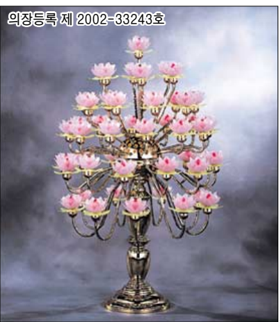
의장등록 제 2002-33243호