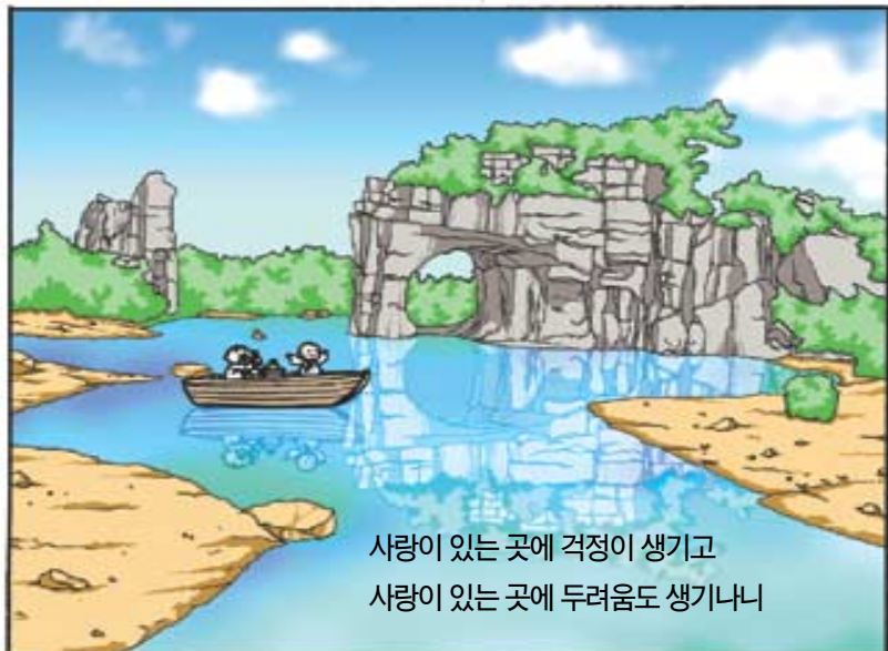
사랑이 있는 곳에 걱정이 생기고 사랑이 있는 곳에 두려움도 생기나니