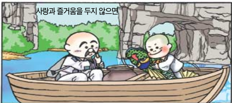
사랑과 즐거움을 두지 않으면