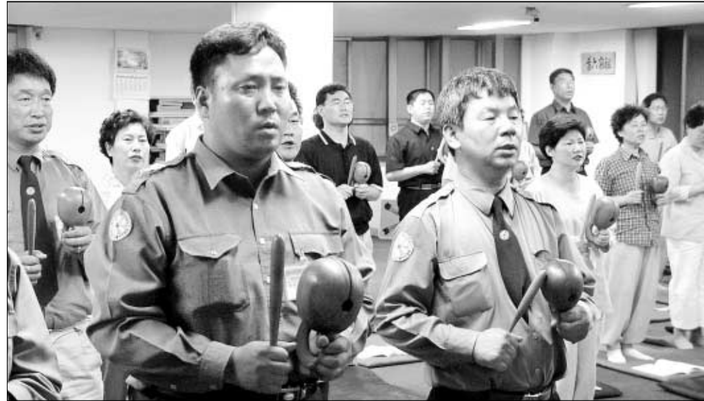
“육탁 집전하는 법 배워요”

프로그램을 중심으로 진행된다. 이 밖에도 한국교수불자연합회(회장 연기영)는 8월 19-21일 백담사에서 제1회 동아시아교수불자대회 겸 제2회 한국교수불자대회를 연다. 철야정진과 수계법회 등의 합동