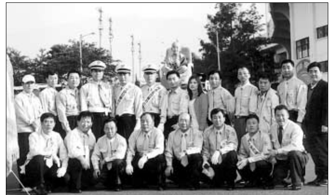
○운불련 제주지역회원들이 올해 '부처님 오신 날' 제등행렬에 참석한 뒤, 기념촬영을 하고 있다. 앉아있는 동자승의 모습이 친진만만하다.

했습니다. 불자회 이름을 달고 첫 시동을 걸었던 그 날, 잊을 수 없는 날입니다. 이후로 50여 회원들이 매달 한 번씩 법회를 열고, 열심히 마음공부를 해왔습니다. 사회봉사 활동도 왕성하게 전개했습니다.