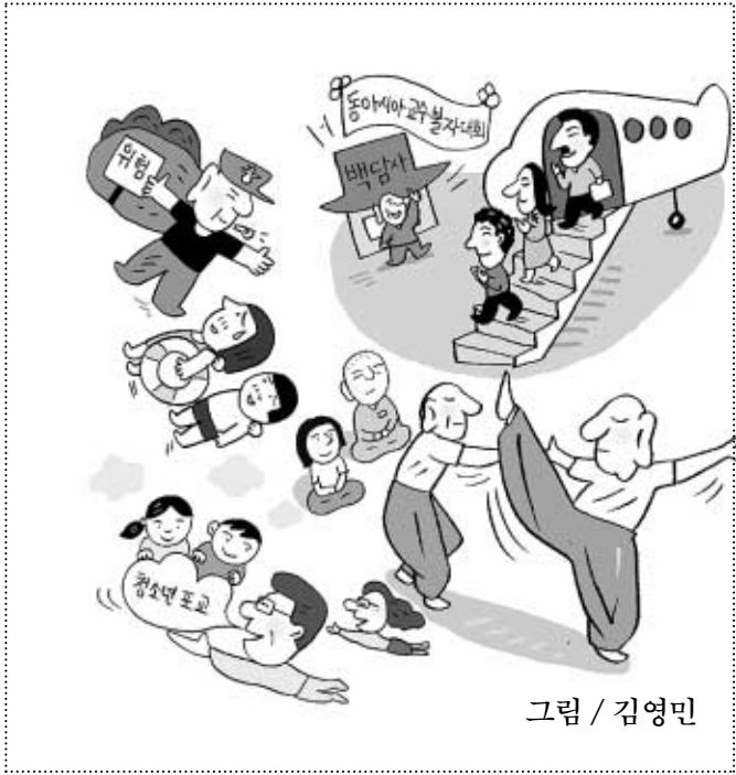
그림 / 김영민