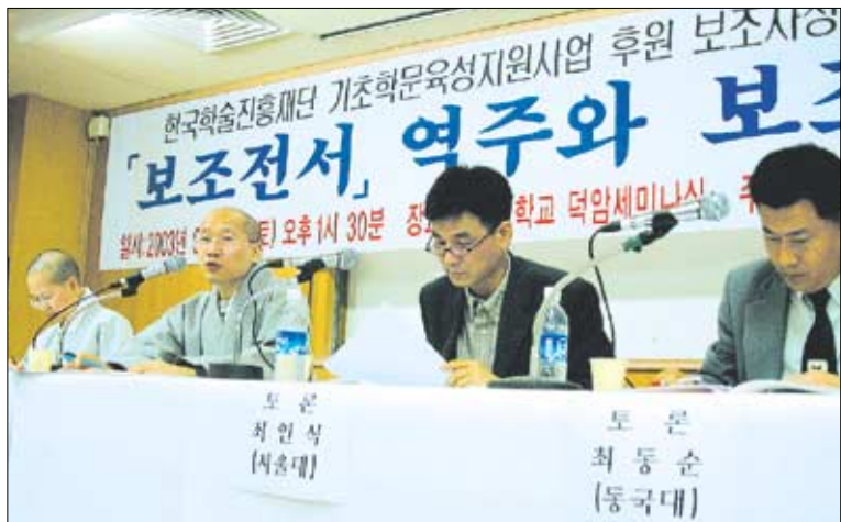
◇한국학술진흥재단 지원으로 '보조전서' 역주 작업을 하고 있는 보조사상연구원은 5월 24일 중간보고를 겸한 학술대회를 개최했다.

1987년 발족한 보조사상연구원이 보조지늘(1158~1210)의 저술과 비문을 한데 모아 1989년 간행한 <보조전서>는 번역하면 원고지 13,000장이 넘는 방대한 분량. 아직도 한글 번역과 주석 작업이 완전히 이루어지지 않았다. 특히 <보조전서>의 60%에 해당하는 <화엄론점요>는 국내에 한글 번역본이 하나도 나와 있지 않은 실정이다.