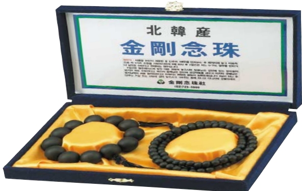
선물로도 최고! 성품에도 최고!