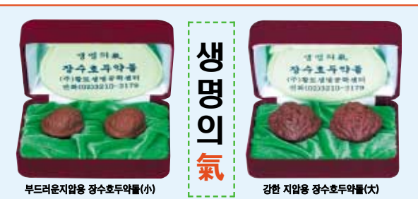
부드러운지압용 장수호두약돌(소) 강한 지압용 장수호두약돌(대)

약위와잡귀들이 보기만해도 도망치는 염험 세계 최고의 신비와 영험의 염주로 전래되는 북한산의 금강염주를 국내 반입하여 조립 시판하고 있어 화제와 인기를 끌고 있습니다. 금강염주는 北韓 평안도 명산에서 소량이 발견되는 세계 하나밖에 없는 희귀 금강석으로 가지고 있는 것만으로도 정신이 안정되며 약위와 잡귀들이 보기만 해도 도망쳐서 액운과 화를 쫓고 동서남북의 복을 불러오며 27가지 소원이 꼭 성취되는 신비와 영험의 염주로 옛날부터 전해오고 있는 염주입니다.