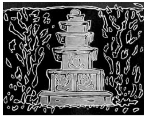
이만익작, '진전사지 3층석탑 국보 122호'.