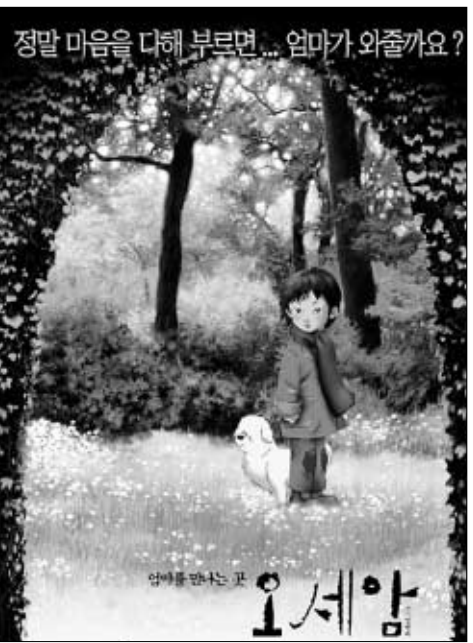
애니메이션 '오세암'의 포스터 사진.

지방에서도 5개 극장이 추가로 이달 말까지 상영 의사를 밝혔다. 이에 따라 서울 2곳, 지방 13곳 등 총 15만 3천여에서 이 작품을 볼 수 있게 됐다.