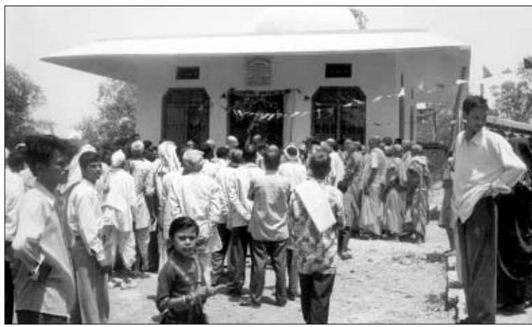
◇인도UP주메인뿌리나비간지 마을법당준공식이 거행됐다.