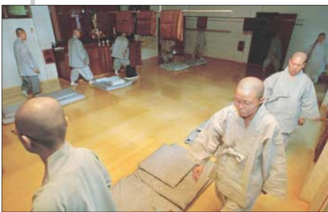
◁결제 첫날 행선 중인 화운사 능인선원.

불기 2547년 하안거 결제일 아침. 기자도 화두 하나 들었다. 감히 은산철벽에 도전하는 화두는 아니고, 선객(禪客)들은 왜 '이렇고'라는 '의심 덩어리'를 내려 놓지 못하