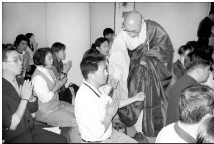
◆불자로 다시 태어난다. 직장불자들은 직장내 강당에서 수계법회를 병행하는 등 ‘일터’를 불국토로 가꿔가고 있다.