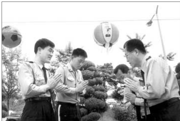
◆대한민국경찰불교회원들은 계급, 나이를 초월해 ‘합장인사하기’를 생활화하고 있다.

하루의 절반 이상을 일터에서 보내는 직장인들. 이들은 꿈을 꾀고 업무와 관련된 꿈을 꾸고 있다고 말한다. 그야말로 직장생활이 삶의 전부인 셈. 갈등도 수없이 빚어진다. 대인관계, 과도한 업무량 등 직장은 회의와 좌절감도 맛보는 곳이다. 최근 전국민주노동조합총연맹이 발표한 <직장생활에 대한 노동자 인식> 조사 결과에 따르면, 가장 좋은 동료로 묻는 질문에 응답자 60.7%가 ‘고민을 같이 나눌 수 있는 동료’라고 꼽았다. 반면 ‘자기 일을 잘 해내는 능력 있는 동료’라고 답한 사람은 불과 18.4%에 그쳤다.