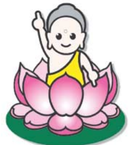
◇봉축위원회가 제작한 연꽃탄생아기부처 캐릭터