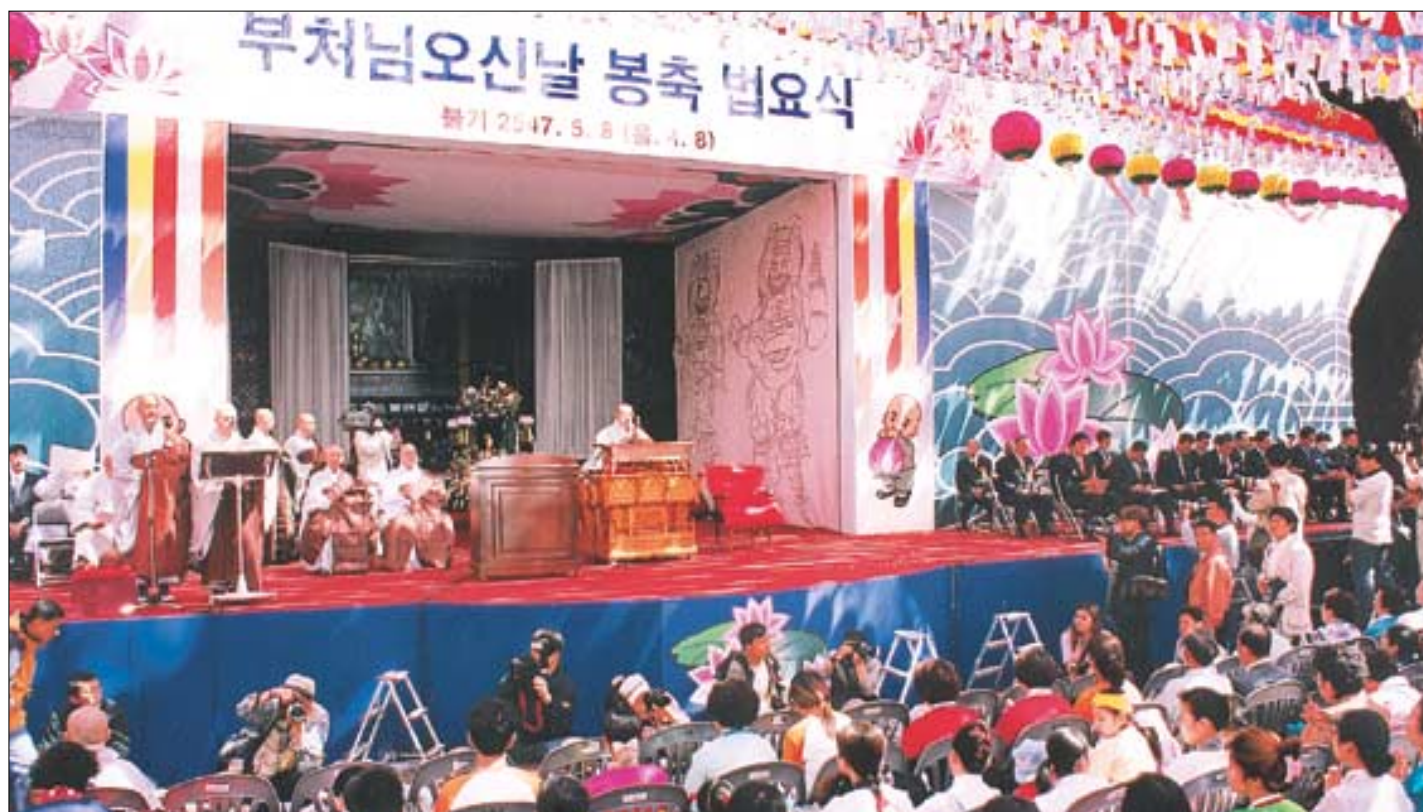
◇불기 2547년 부처님오신날 봉축법요식이 8천여 사부대중이 참석한 가운데 8일 조계사에서 봉행됐다.

이같은 결과는 <현대불교>와 <우리는 선우>가 공동으로 본지 재가불자 구독자 중 1만1천명을 대상으로 실시한 설문조사에 따른 것이다. 설문은 4월21일부터 5월 2일까지 전국에 걸쳐 우편으로 이뤄졌으며, 모두 1,402명이 응답했다.