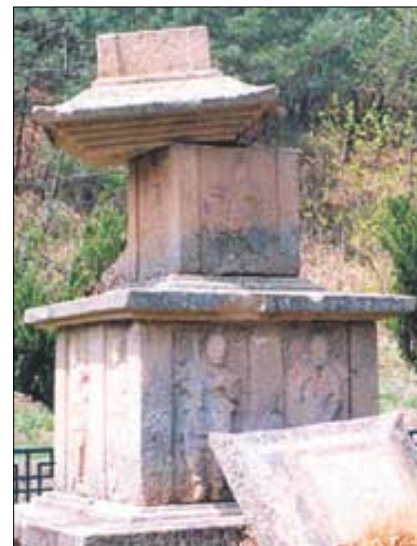
▷탑신이 크게 부서진 모습.