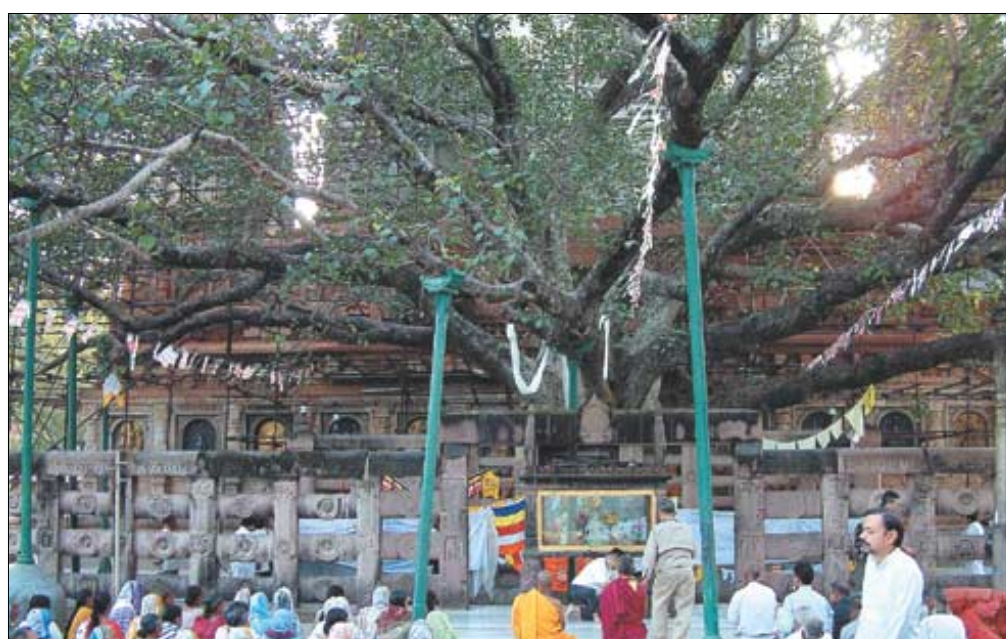
▷부처님이 깨달음을 얻은 마하보디 사원 보리수 밑에서 불자들이 기도를 하고 있다. 보드기아=남동우 기자