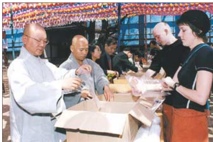
"자비의 선물 받으세요"