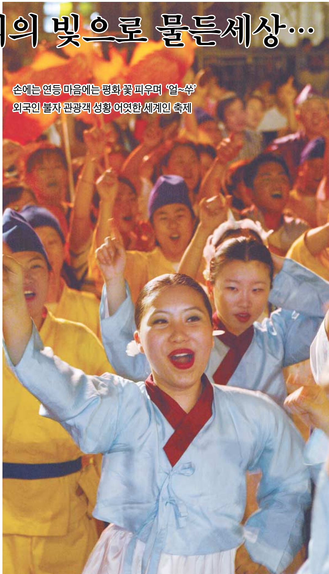
이보다 즐거울순 없다 연등축제는 날씨노소도, 종교적 편견도 뛰어넘는 국제 최대의 잔치마당이다. 그래서 부처님의 가르침대로 나와 내의 벽을 허물고 인간 본래의 청정함으로 살기를 염원하며 내 가족이 부처이고 내 이웃이 부처이며 이 땅이 극락임을 확인하는 연등축제. 환희하는 참가자들의 얼굴은 극락의 꽃이다.

손에는 연등 마음에는 평화 꽃 피우며 '얼~썩' 외국인 불자 관광객 성황 어엿한 세계인 축제