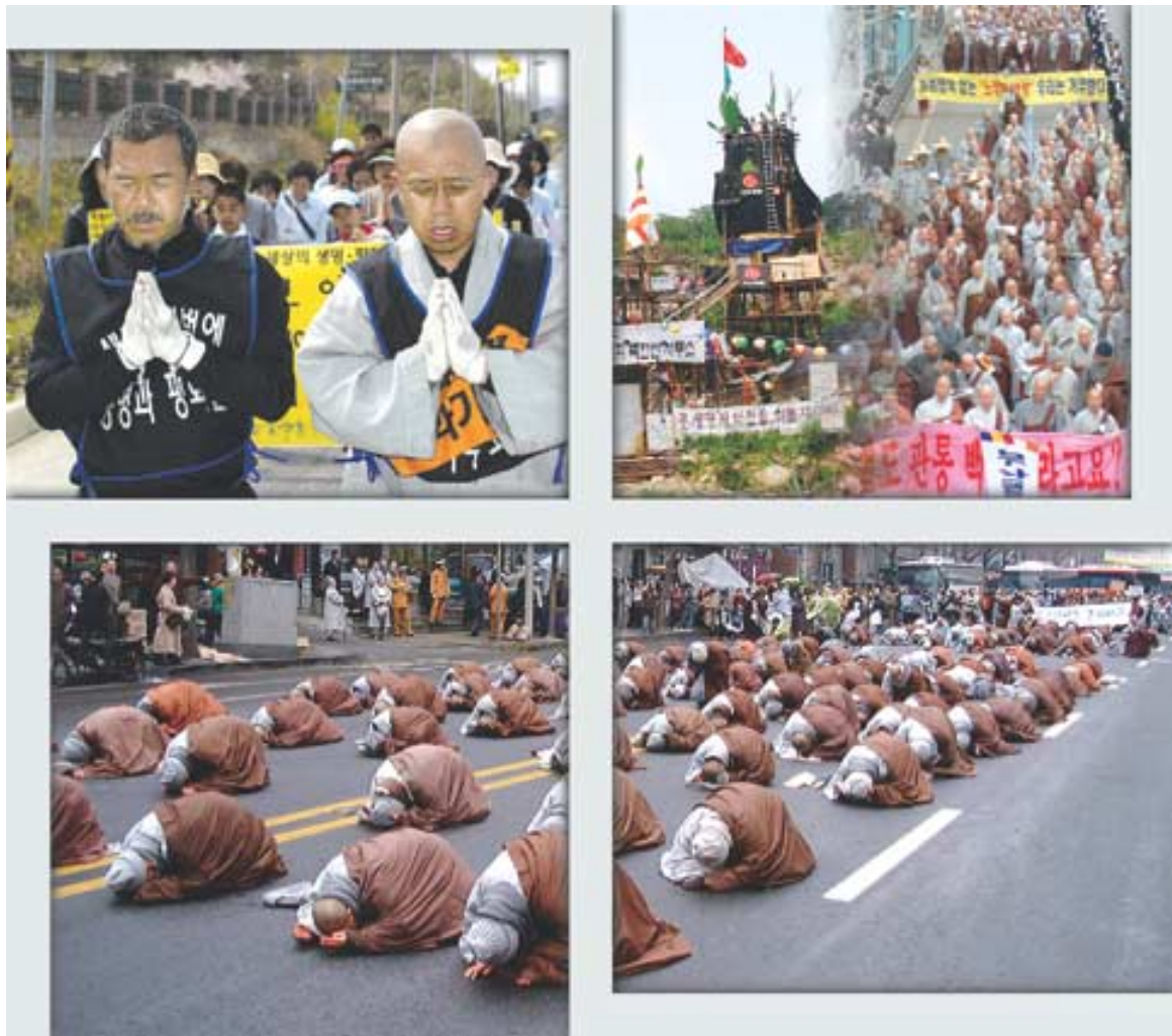
◇불교계 환경운동은 수행환경 수호의 차원을 넘어 생명운동으로 확산되고 있다.