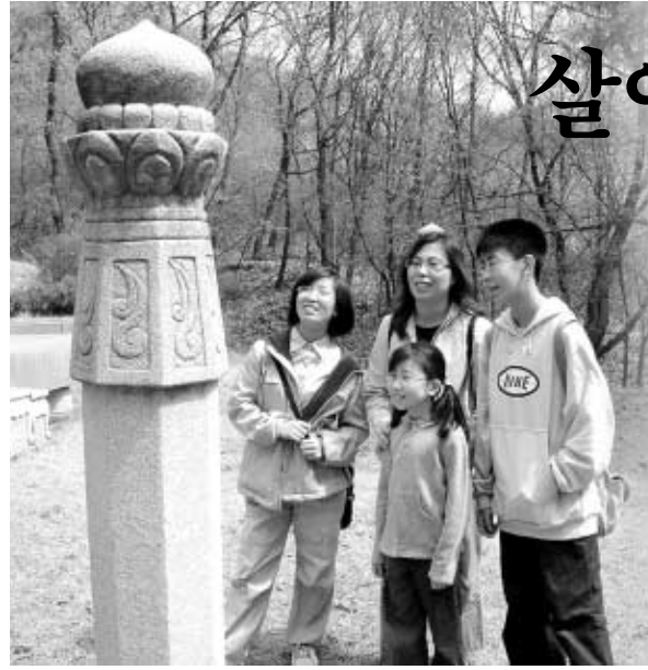
◇13일 두레생태기행의 도봉산 유적답사에 참가한 현구내 가족의 모습.

히 들었다. 병장이 되어서는 수계도 받았다. 군대생활은 내게 아픈 상처도 많이 주었지만 불법을 만나니 소중한 징검다리 가 되어준 것이다. 지금은 학교에서 아침마다 108배를 하고 조석 예불을 올린다. 목요일이면 정기법회에 참석해 법사님께 설법을 듣는다. 어느덧 내 생활의 중심은 불교인 것이다. 화가 나고 짜증이 날 때마다 불단 앞에서 ‘관세음보살’을 염하며 기도를 하다 보면 나도 모르게 마음이 가라앉는다. 지난 겨울 방학에는 인도에 갔다. 부처님께서 고행을 하던 장각산에 올라가 무열동굴도 보며 부처님의 숨결을 느꼈다. 또 전쟁의 아픔을 겪은 아프간에서 고통 받는 사람들을 만나고 왔다. 그때 나는 파키스탄 라호르 박물관에 있는 부처님 고행상을 보며 맹세했다. “부처님의 발자취를 따라 수행정진 하리라.”