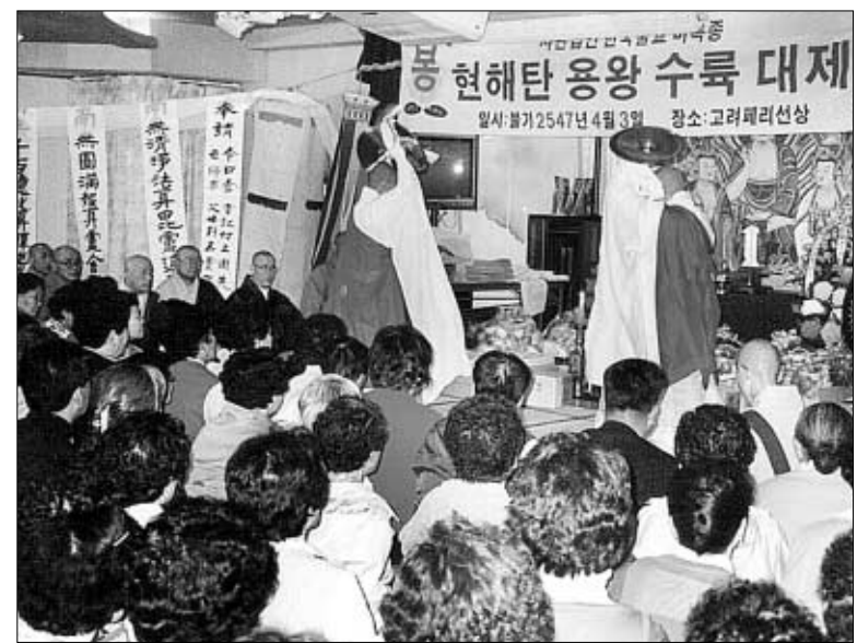
◇미륵종은 3일 부산항을 출발, 현해탄을 건너는 배안에서 수륙대재를 봉행하고 6일까지 일본 불교성지를 순례했다.

나고, 모든 사람들도 다함께 행복해졌으면 한다"며 108배 기도와 지장보살 정근으로 마음을 모았다. 특히 이번 일본 성지순례에서는 길이 41m의 외불 속에 부처님 진신 사리가 모셔진 남장원을 방문, 일본 불교의 이모저모를 살펴보고, 한국 불교미륵종과 일본 남장원과의 교류를 약속했다. 총무원장 송정스님은 "한국불교와 일본 불교와의 활기찬 교류를 기대한다"며 "앞으로 있을 한일 불교 행사에서 자주 만날 수 있길 바란다"고 말했다. 3박 4일 동안 이어진 미륵종 현해탄 수륙대재는 아소산 방문, 벃부 방문, 회향법회 등의 일정을 마치고 6일 회향했다. 일본=천미희 기자